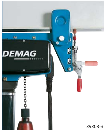
Einhandhebel für die Feststellung des Fahrwerks