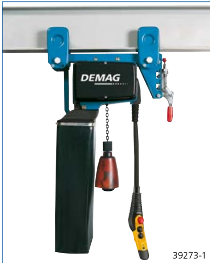
Die niedrige Bauform ist bei den teilweise beengten Platzverhältnissen in der Gondel besonders vorteilhaft