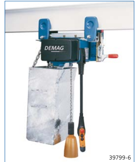
Blechkettenspeicher für große Kettenlängen und/oder besondere Anforderungen